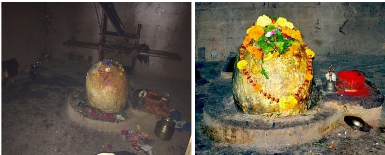
बिजली महादेव मन्दिर में विद्यमान शिवलिंग

शिवलिंग के बिल्कुल करीब आरती का पीतल वाला दिया ही विस्फोट का केन्द्र बन जाता है। कच्चे पत्थर की बनी बेचारी शिवलिंग के टुकड़े-टुकड़े हो जाते हैं।