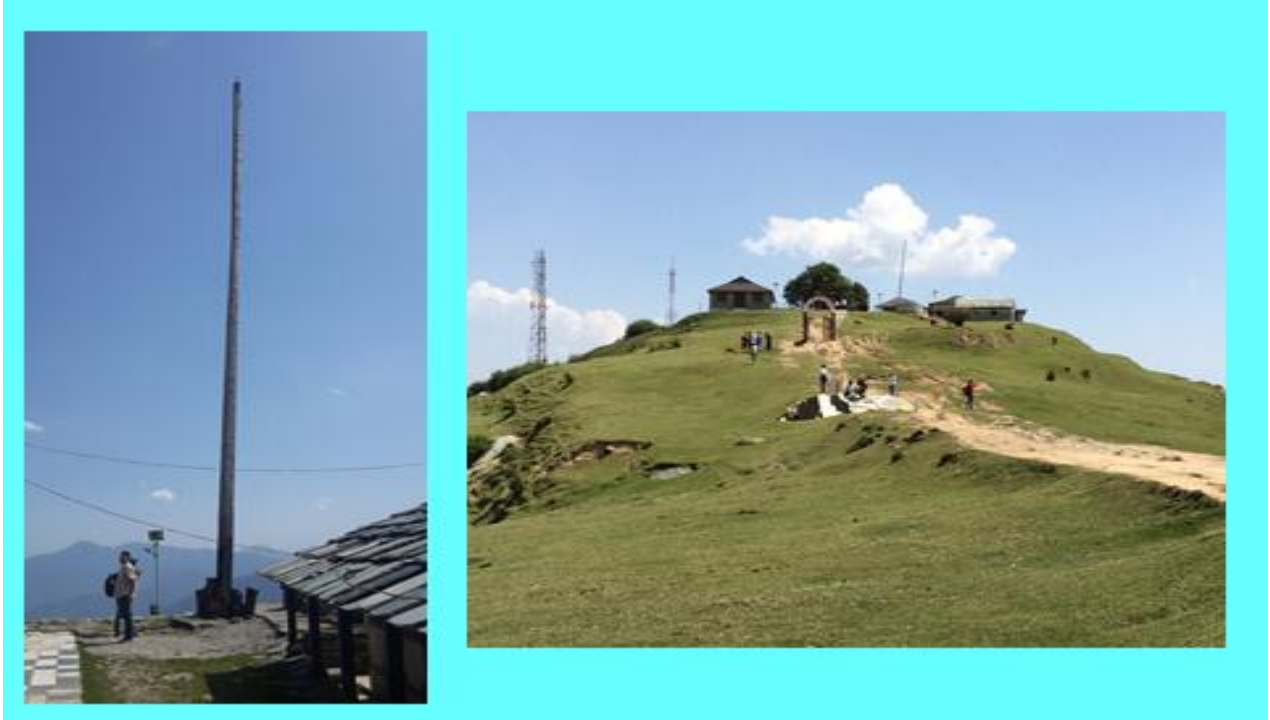
बिजली महादेव मन्दिर का बाहरी दृश्य (६० फीट का लकड़ी का खम्भा बायें तथा प्रवेश द्वार दायें)